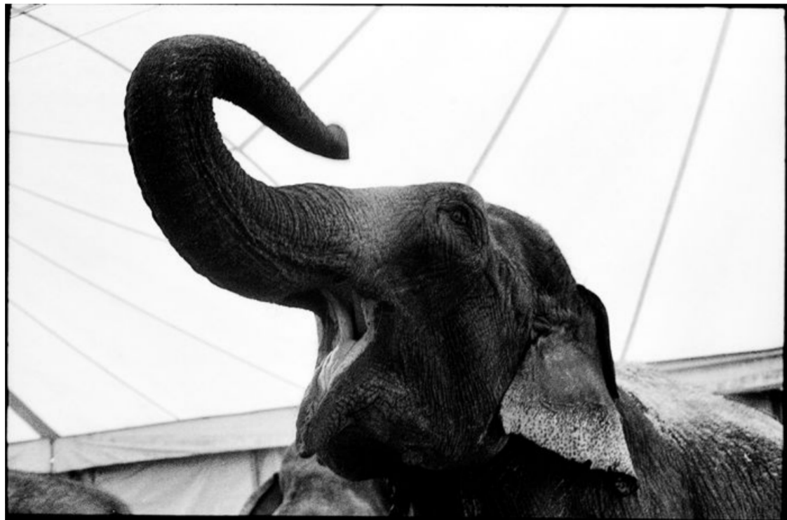
Danes so v določenih primerih v evropskih cirkusih dovoljene le domače živali.

V nekaterih delih sveta je to še mogoče videti. V Vietnamu, Kambožji in na Kitajskem v cirkuskih