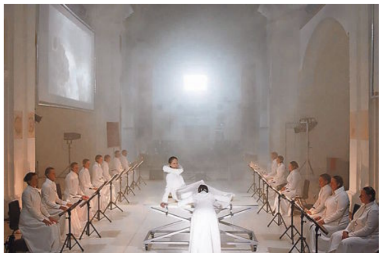
Projekt Threnos je prejel nagrado v konkurenci 150 predstav z vsega sveta.

šah. Od leta 2008 je na tekmovanju sodelovalo več kot tisoč svetovnih premier nove opere in glasbenega gledališča kot del tega edinstvene-