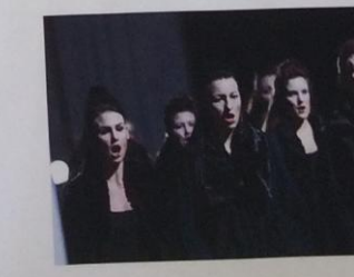
Toxic Psalms, directed by Karmina Silec: 'a reflection of the spiritual anguish of today'.

...očez je raz ...očez je raz ...očez je raz