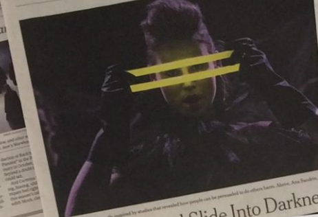
"Toxic Psalms" was partly inspired by studies that revealed how people can be persuaded to do others harm.

Christie's and Sotheby's promise best prices.