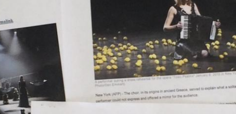
The choir, in its origins in ancient Greece, wanted to explain what a solitary performer could not express and offered a novel for the ages.

Choir explores collective brutality on New York stage